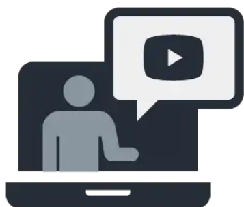
Capacitacion y Soporte