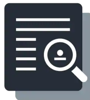
Casos de estudio