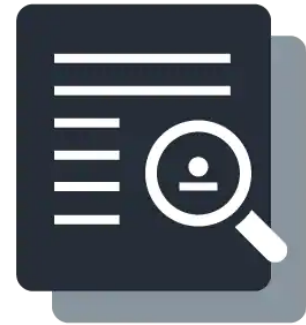
Casos de estudio