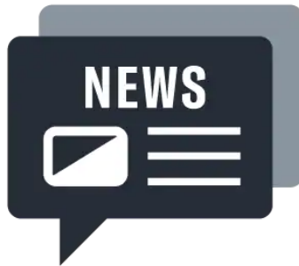
Noticias y Eventos